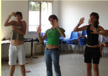
Les Italiennes se prennent au jeu

D'après ce que nous avons vu, le mime est d'abord basé sur la concentration. Le mime se fait avec de la tension et du repos. On agit d'abord membre par membre. Pour mieux donner une direction et un rythme, l'animateur met de la musique et/ou un jeu de lumière. Après s'être échauffés, les élèves forment des groupes de 3 ou 4 et font une petite impro de mime.